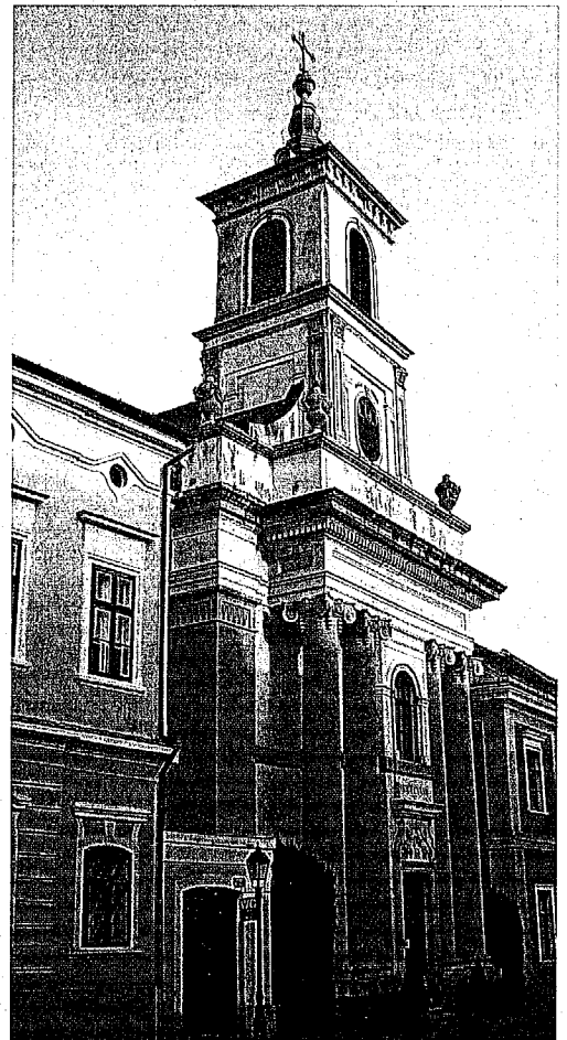
A piaristák veszprémi Szent Imre-temploma egybeépült a rendházzal – falai között sok fiatal imája szállt az ifjak védőszentjéhez

„Kicsinyeknek Atyja, érényekre példa. / Nézz reánk a mennyből tanítványaidra! Lásd a főbábszokó fiatal csapatot / Reád van bízva, Általad legyen Krisztusnak ajánlva.”